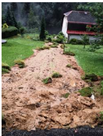
Stav po přívalovém dešti

Vlivem silného přívalového deště v noci z 29.7. na 30.7.2013 došlo k ujetí části svahu pod místní komunikací na Záborčí. Bezprostředně po nahlášení mimořádné události byla provedena prohlídka za