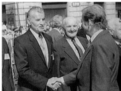
Čestmír Šikola se zdraví s prezidentem Václavem Havlem na vzpomínkové akci v Resllově ulici (18. červen 1990)