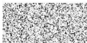
Zhotovitel: Ing. Evžen Kozák VEDU VODU s.r.o.

VODNOSPONÁŘSKÉ SDRUŽENÍ TURNOV A. Dvořáka 287, 511 01 Turnov DIČ: CZ49285904, IČO: 49285904 tel: 481 313 481