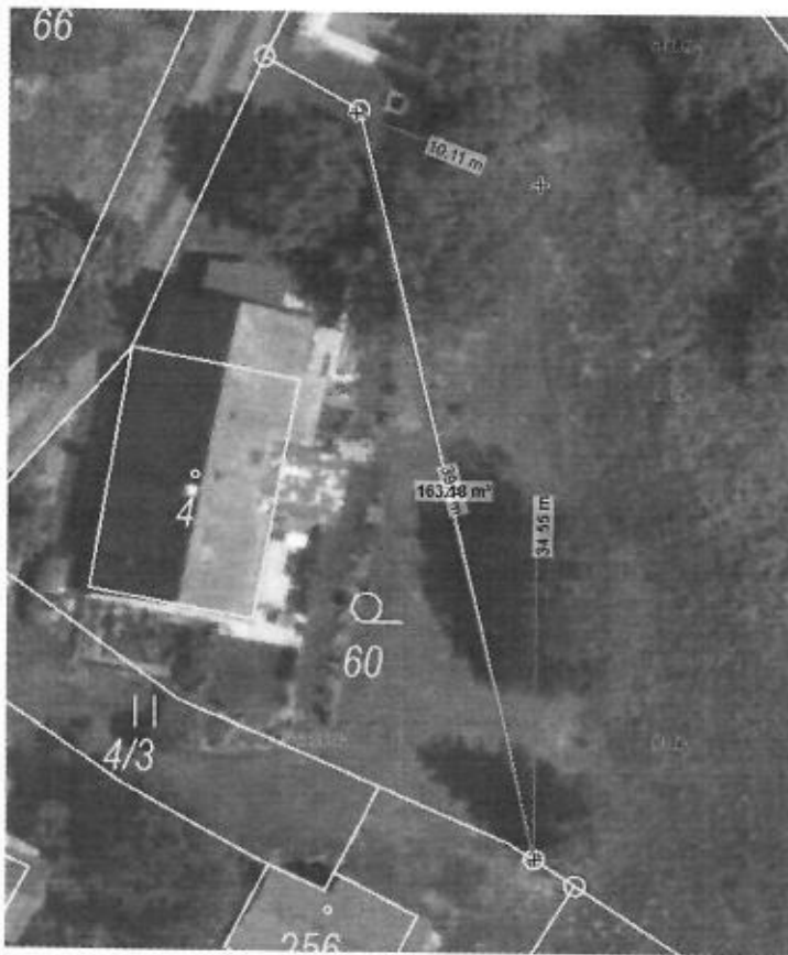
Celková plocha je cca 160m 2